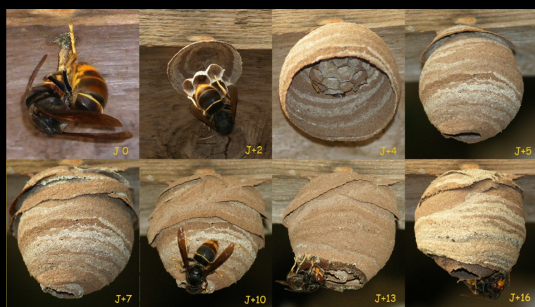
NIDS PRIMAIRES (faciles à détruire)

Le piégeage préventif n'est pas recommandé (risque pour autres insectes) et est réservé aux apiculteurs.